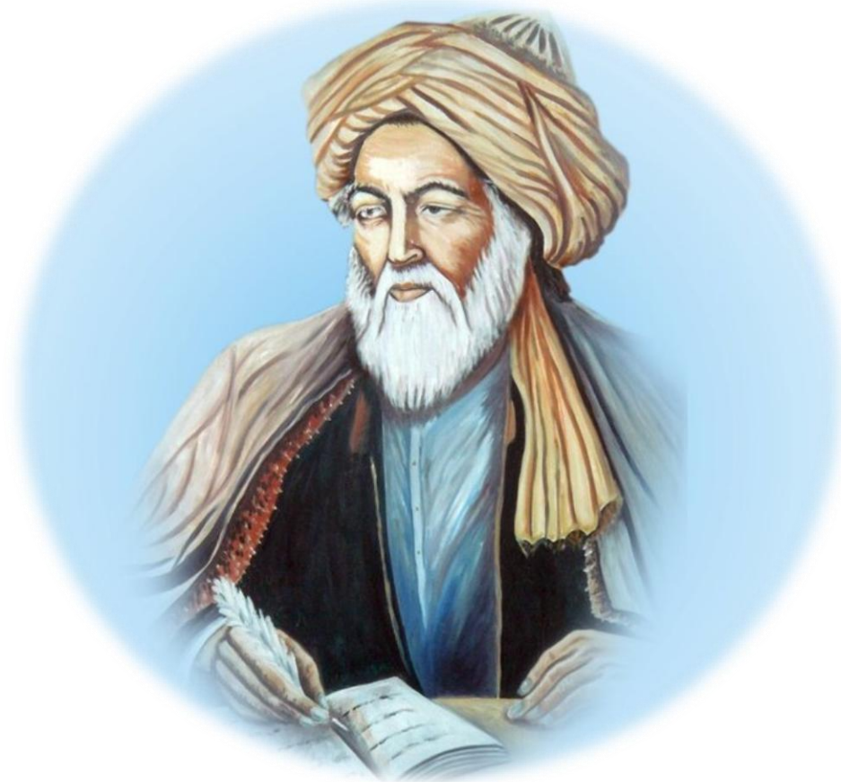
ناصر خسرو قبادیانی